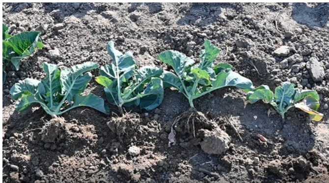
Foto 2: Planten uit verschillende objecten zes weken na planten, van rechts naar links: plantbakbehandeling met aaltjes; twee behandelingen met aaltjes (plantbak + tweede behandeling in het veld twee weken na planten); spinosad plantbakbehandeling en onbehandelde controle (20 mei 2020)

Hoewel we er nog niet in slaagden de werking van de aaltjes sterk te verbeteren in de veldproeven, tonen de resultaten nieuwe perspectieven om de toepassingen verder te optimaliseren. In de komende jaren werken we samen met Koppert en Biobest hieraan verder.